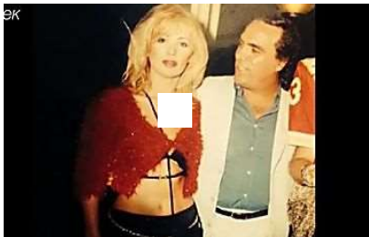
Tina Cipollari da giovane, la foto su Instagram lascia a bocca aperta